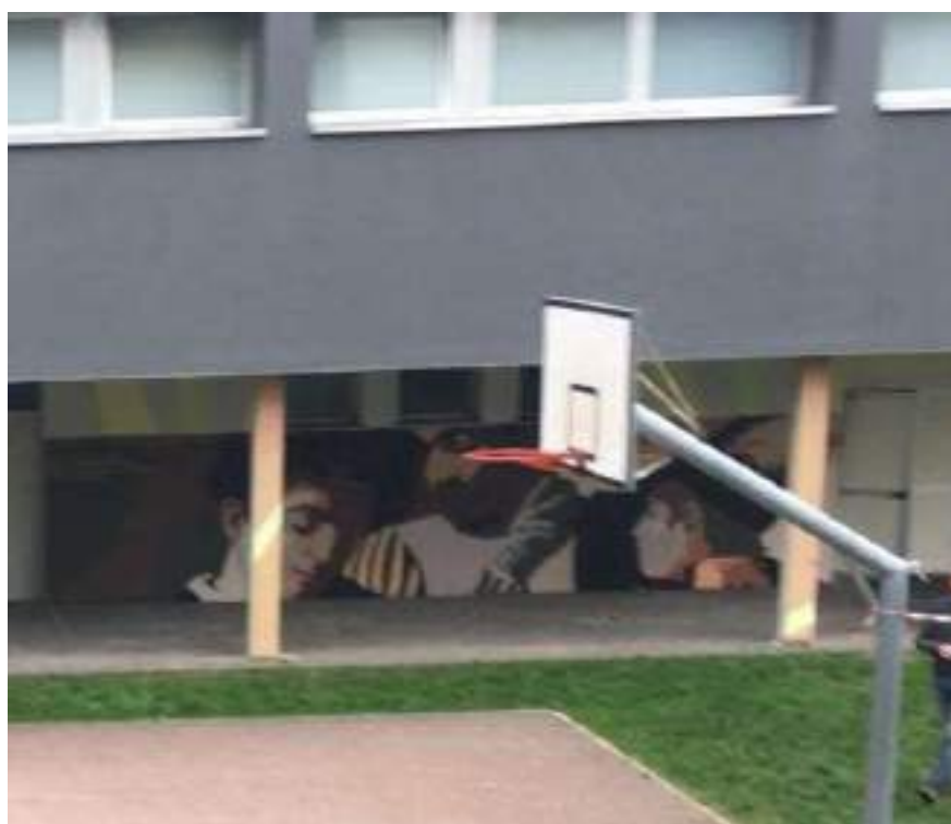
CORTILE con campo da basket