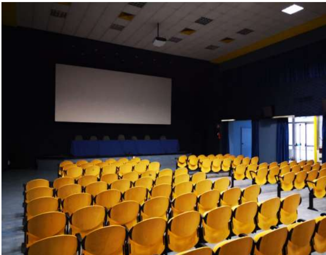
AULA MAGNA di oltre trecento posti con impianto audio e video di ultima generazione funzionale a proiezioni cinematografiche