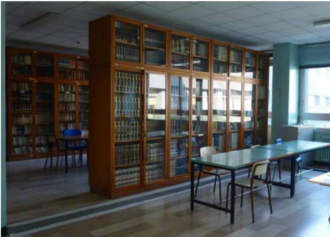
BIBLIOTECA e MEDIATECA